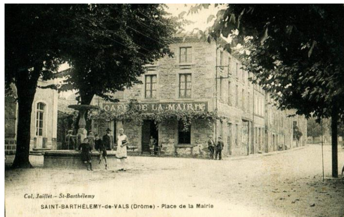
Col. Jaillot - St-Barthélemy SAINT-BARTHÉLEMY-de-VALS (Drôme) - Place de la Mairie