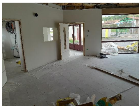
Salle de Lecture